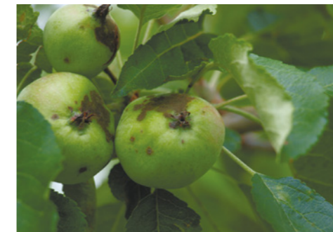
Контроль (без обработки)