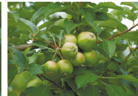
Делан® Фло (0,7 л/га) + Серкадис® (0,25 л/га)