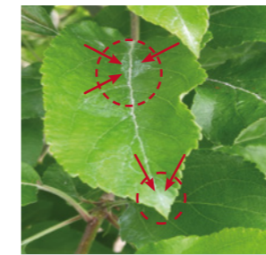
д.в. каптан (800 г/кг), 1,8 кг/га