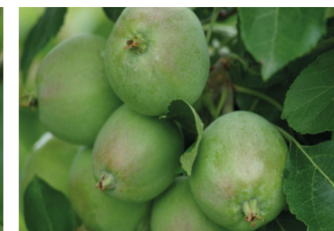
Делан® Фло (0,5 л/га)