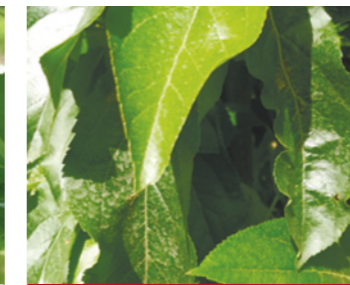
Делан® Фло (0,5 л/га)